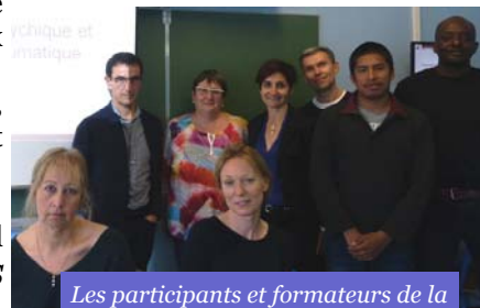
Les participants et formateurs de la première session de formation

La première session, dédiée au grand public, s'est déroulée les samedis 22 et 29 avril 2017 et a donné entière satisfaction aux participants.