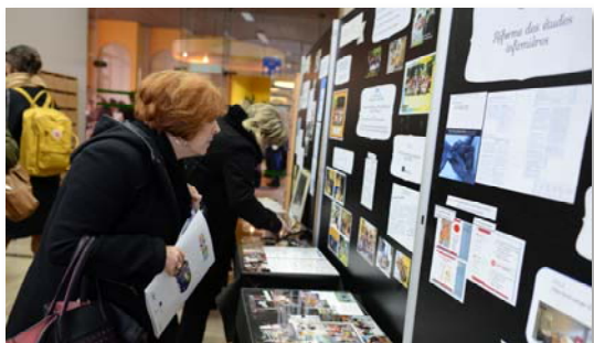
Exposition « 1946-2016 : histoire et perspectives d'avenir de l'institut »