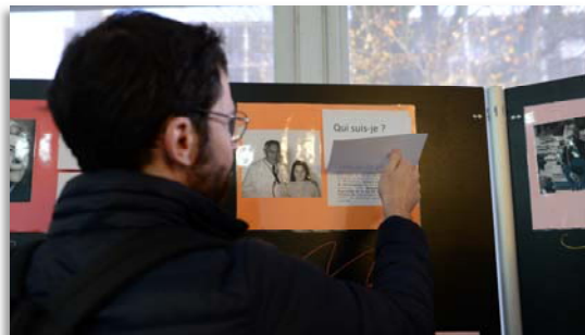
Exposition « la pédiatrie de 1946 à nos jours »