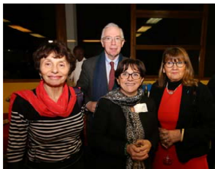
Cocktail de convivialité