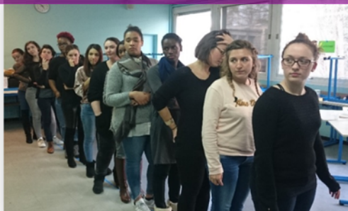
Jeu du débat mouvant animé par l'association Under Construction

Au menu : des méthodes pédagogiques diversifiées à type d'apport d'information, de jeux dans le cadre de l'animation de l'association Under Construction ( http://www.underconstruction.fr ), de formation sur des outils en éducation pour la santé, de débats qui ont permis de réfléchir autour des différents thèmes.