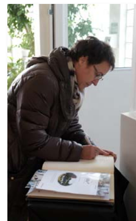
Signature du livre d'or