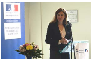
Juliette Méadel, lors du lancement de la formation « Aux mots qui sauvent »

Juliette Méadel, secrétaire d'Etat auprès du premier ministre, chargée de l'Aide aux victimes a lancé la formation « Aux mots qui sauvent » le mercredi 29 mars 2017 , dans le cadre de son plan d'action en 6 axes pour un meilleur accompagnement des personnes victimes de psycho-traumatismes.