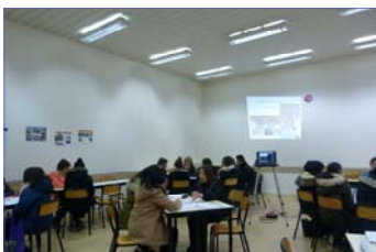
Les futurs candidats échantent avec les formateurs

Le samedi 21 janvier 2017, le personnel, les étudiants et les élèves de l'IFITS se sont mobilisés pour accueillir les visiteurs de la quatorzième Journée Portes Ouvertes de l'Institut.