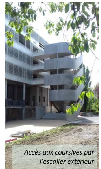
Accès aux coursives par l'escalier extérieur