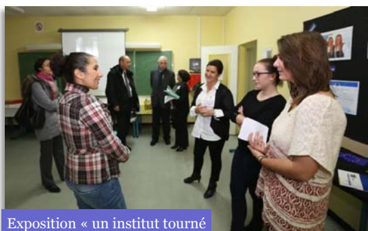
Exposition « un institut tourné vers l'international »