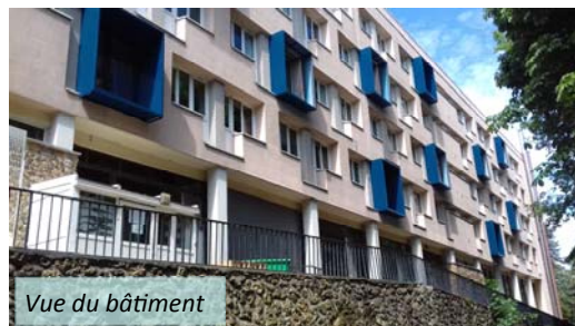
Vue du bâtiment