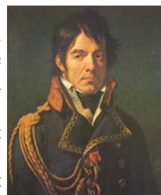
Le baron Jean-Dominique Larrey par Anne-Louise Girodet de Roussy-Trivison

2010 Les Auxiliaires ambulanciers doivent être titulaires de l'Attestation de Formation aux Gestes et Soins d'Urgences 2 (AFGSU 2).