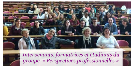
Intervenants, formatrices et étudiants du groupe « Perspectives professionnelles »