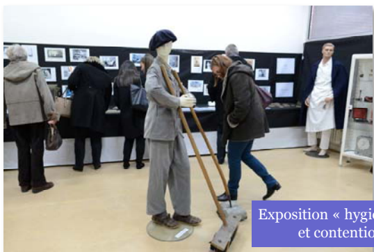
Exposition « hygiène, soins et contention »