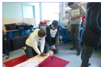
Stand gestes d'urgence

Nous remercions élèves, étudiants et personnels de l'IFITS qui ont participé activement au succès de cette journée.