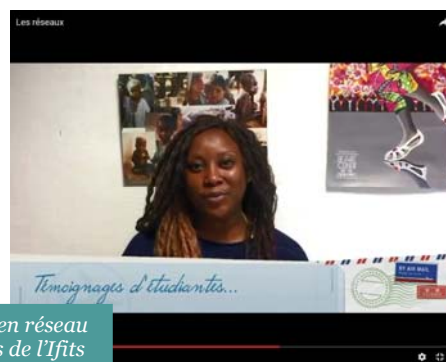
Captures d'écran du film sur le travail en réseau réalisé par les formatrices et étudiantes de l'Ifits

Le film est disponible sur Youtube : https://www.youtube.com/watch?v=ZoUrqjDZL88&feature=youtu.be