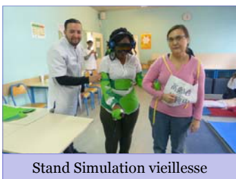
Stand Simulation vieillesse