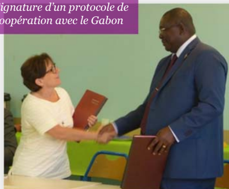
Signature d'un protocole de coopération avec le Gabon

Pour la deuxième fois cette année, des soignants sont venus à l'Ifits pour suivre un programme de formation au tutorat (dans le cadre de l'encadrement de nos étudiants sur leur structure de santé) mais aussi afin de renforcer leurs compétences autour de la qualité des soins et de l'éducation à la santé.