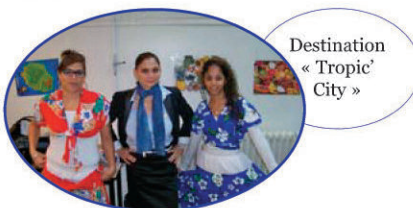
Destination « Tropic' City »