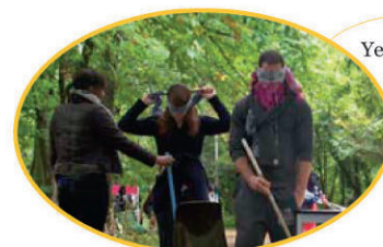
Yeux grands fermés