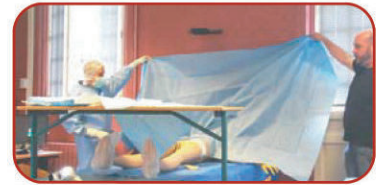
Équipe pédagogique Filière aide-soignante

Cette forme d'enseignement a été plébiscitée par les futurs professionnels et l'intervenant. Suite à ce vif succès, les formateurs souhaitent renouveler voire multiplier l'utilisation de cette méthode innovante.