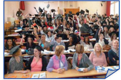
Remise des diplômes infirmiers

Un grand moment dans l'histoire de la profession infirmière : l'entrée dans le système LMD se concrétise par l'arrivée des premiers infirmiers licenciés dans le monde professionnel et l'entrée en Master pour les infirmiers anesthésistes.