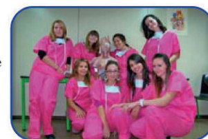
La course aux organes