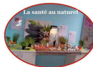
La santé au naturel