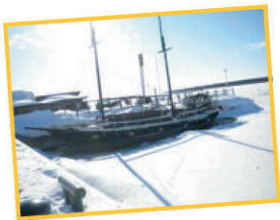
Mer baltique congelée