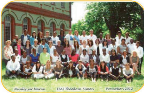
Promotion aide-soignante 2012

Cette année encore l'Ifits est fier de ses taux de réussite :