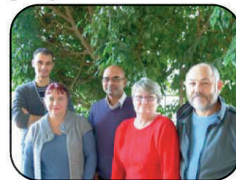
L'équipe de l'intendance

Le respect que vous portez à nos prestations permet de mieux vivre dans nos espaces partagés.