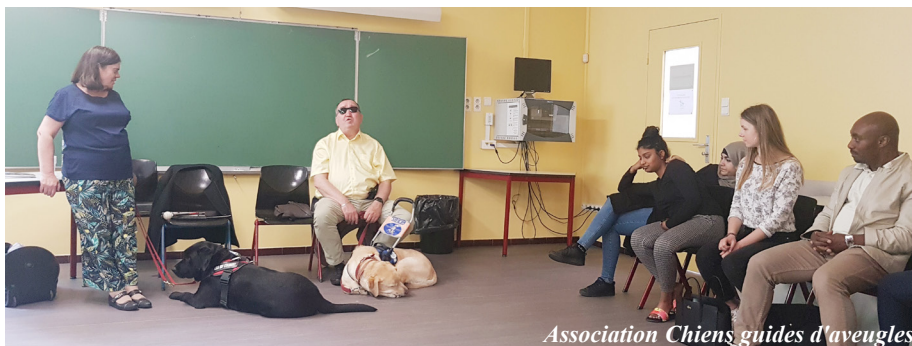
Association Chiens guides d'aveugles

SUR LA JOURNEE DE SENSIBILISATION AU HANDICAP ORGANISEE A L'IFITS LE 23 MAI 2019