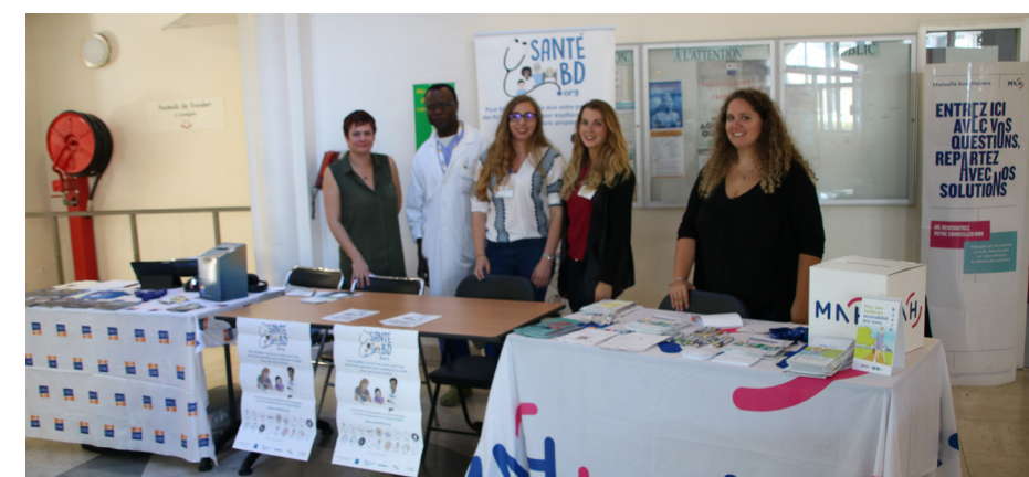
Stands tenus par les étudiants : Santé BD (présentation d'outils pédagogiques pour mieux comprendre la santé) et le stand MNH.